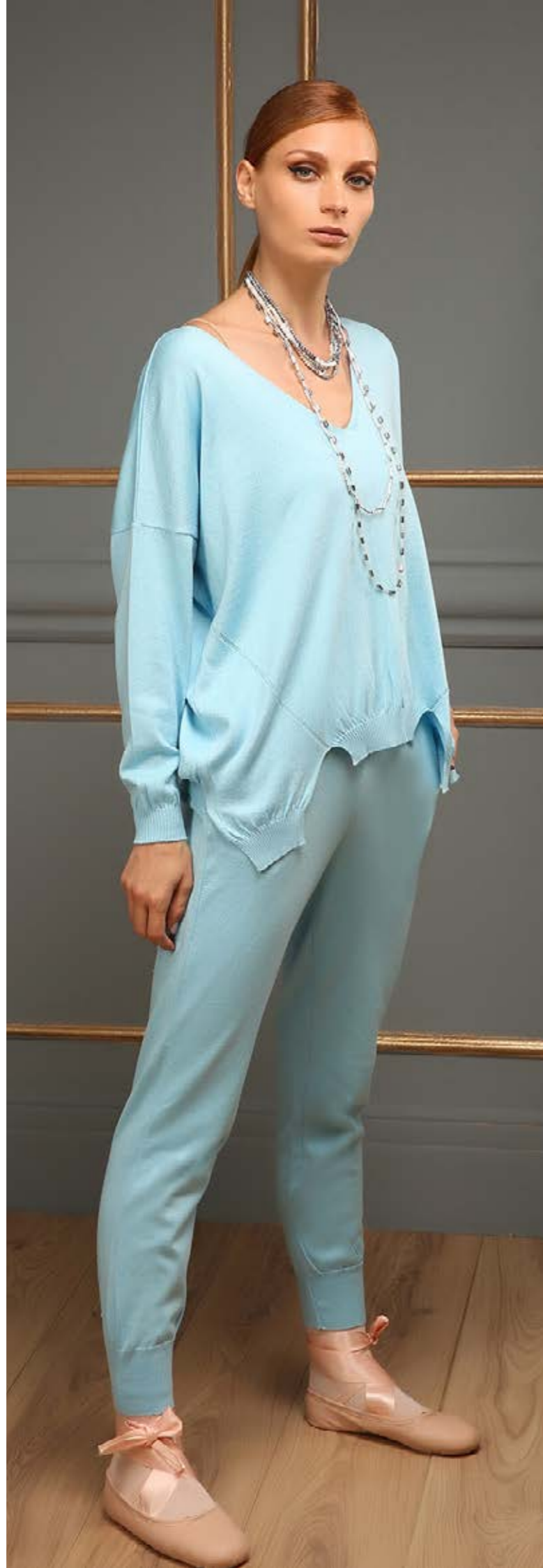
Blouse : NF2139 Pants : NF2148