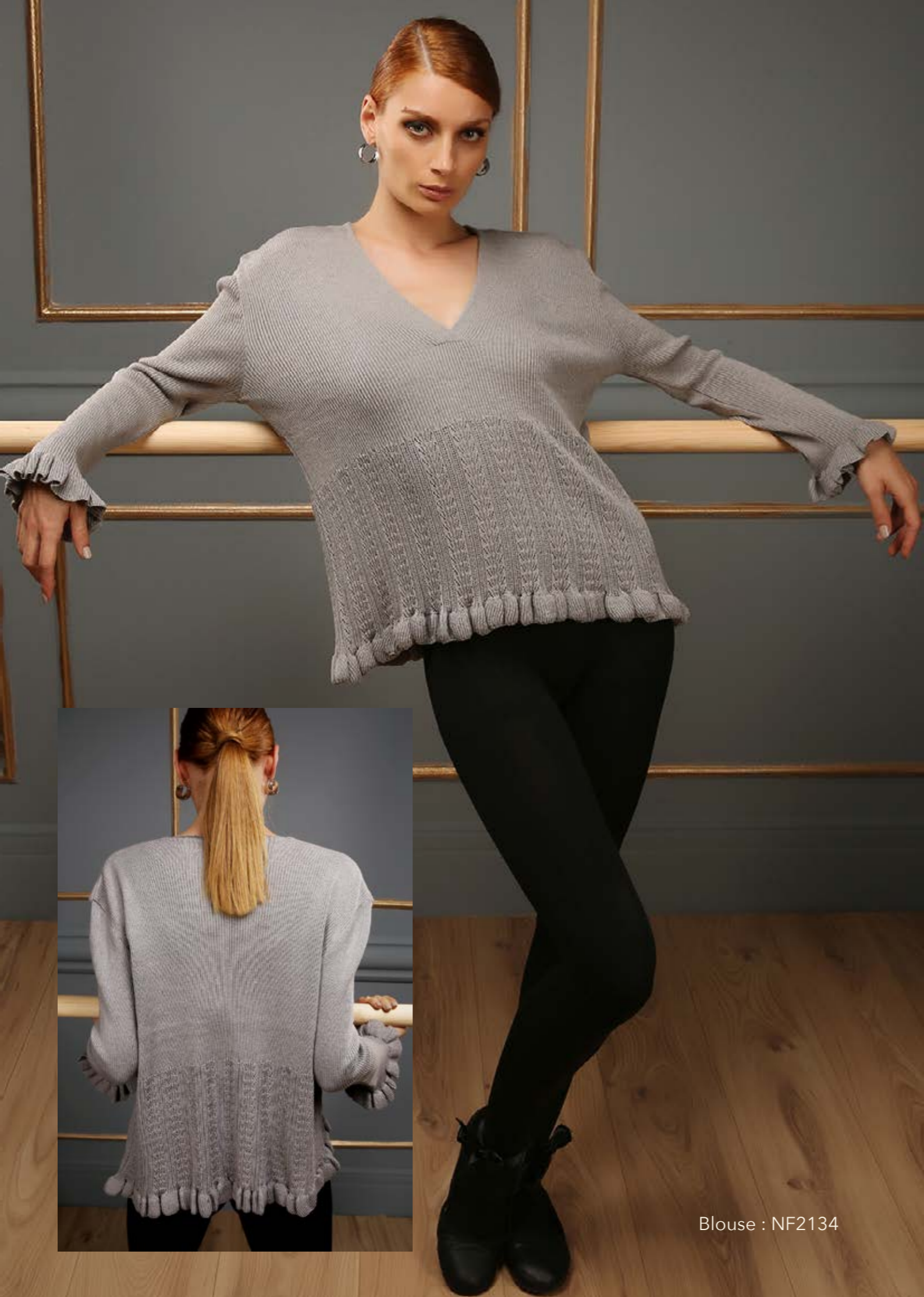
Blouse : NF2134