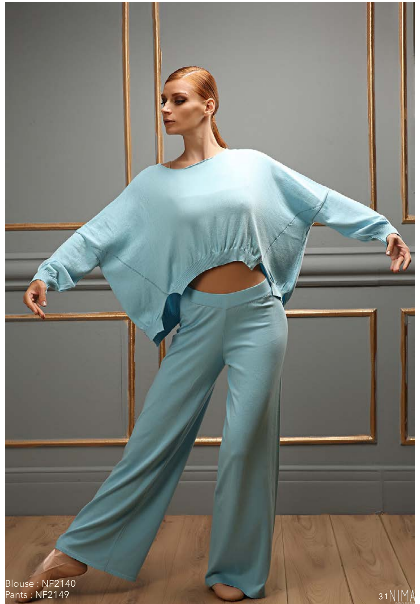
Blouse : NF2140 Pants : NF2149