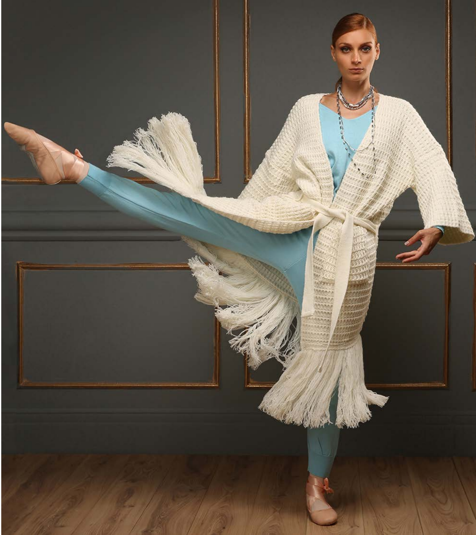
Cardigan : NF2143 Blouse : NF2139 Pants : NF2148