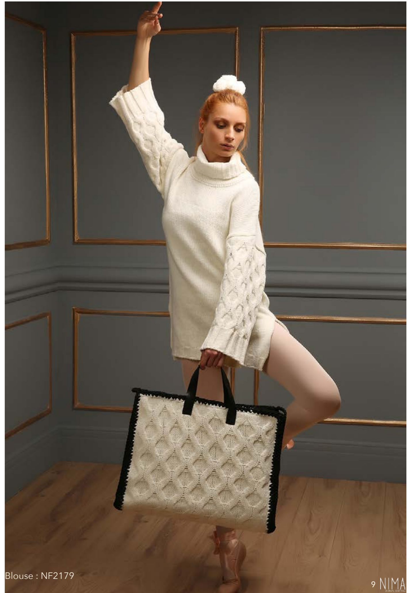
Blouse : NF2179