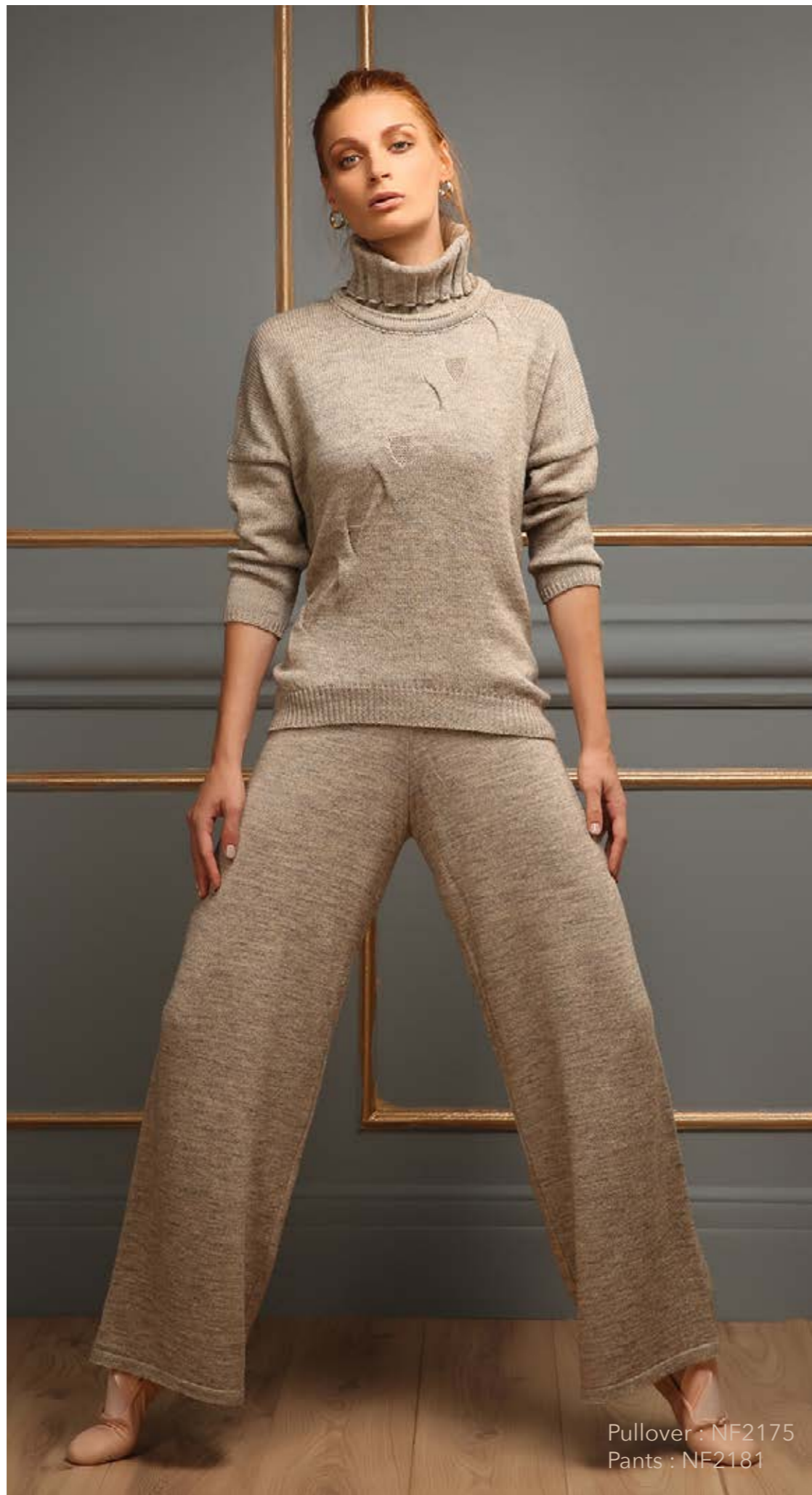
Pullover : NF2175 Pants : NF2181