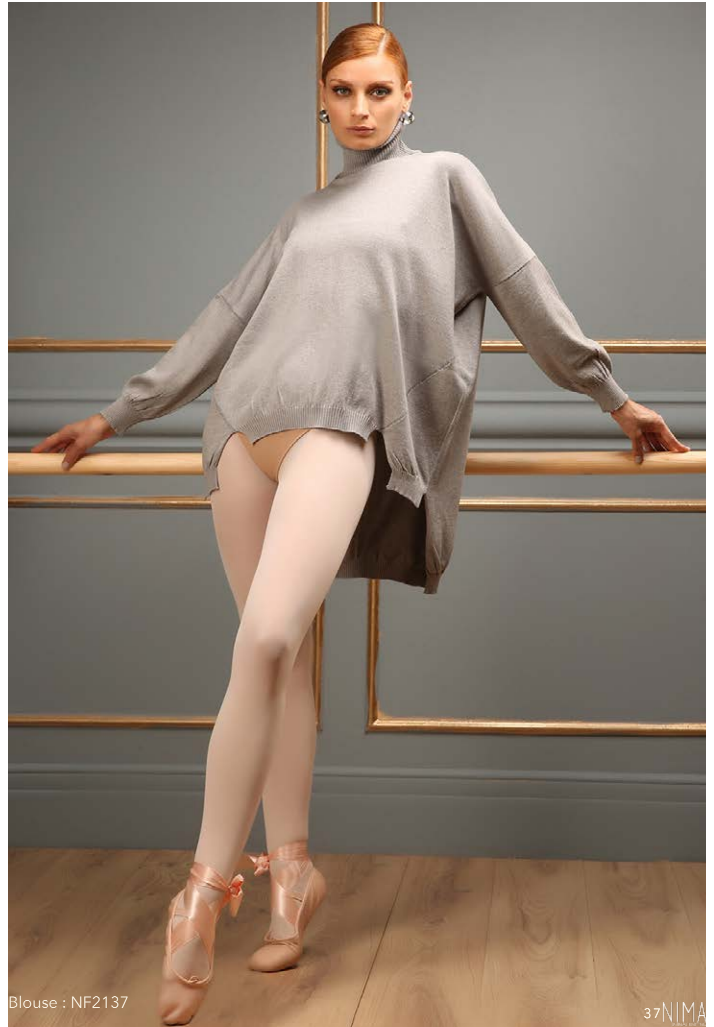
Blouse : NF2137