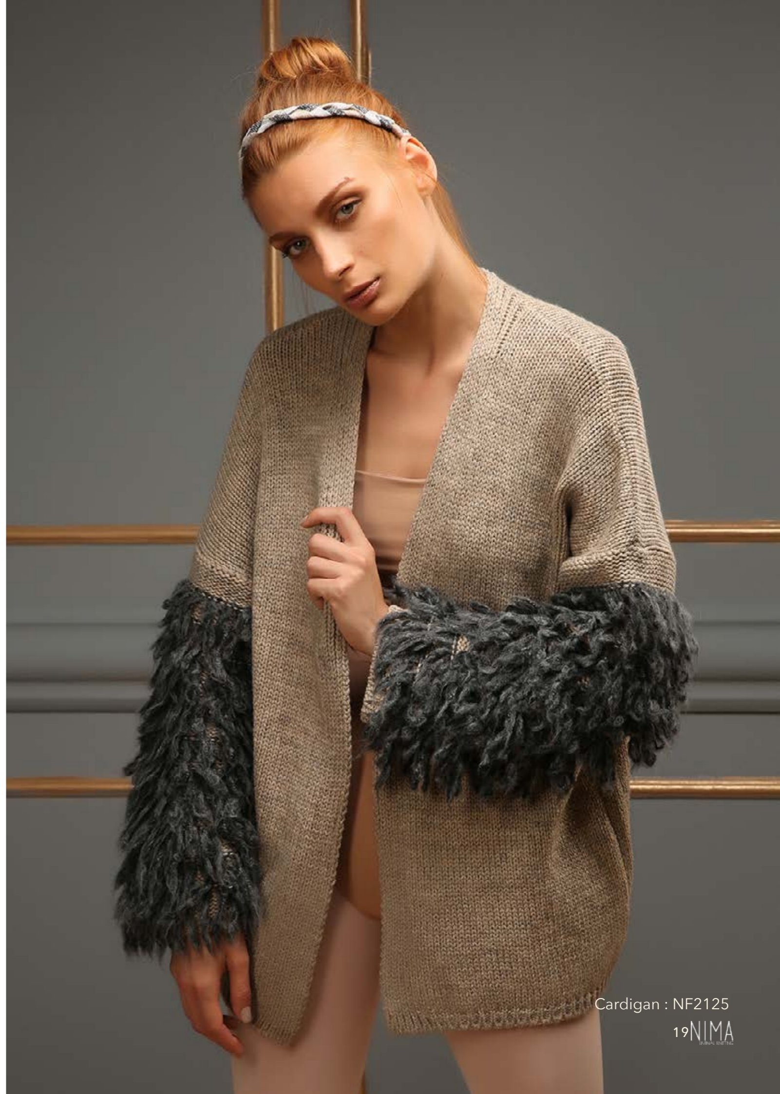
Cardigan : NF2125