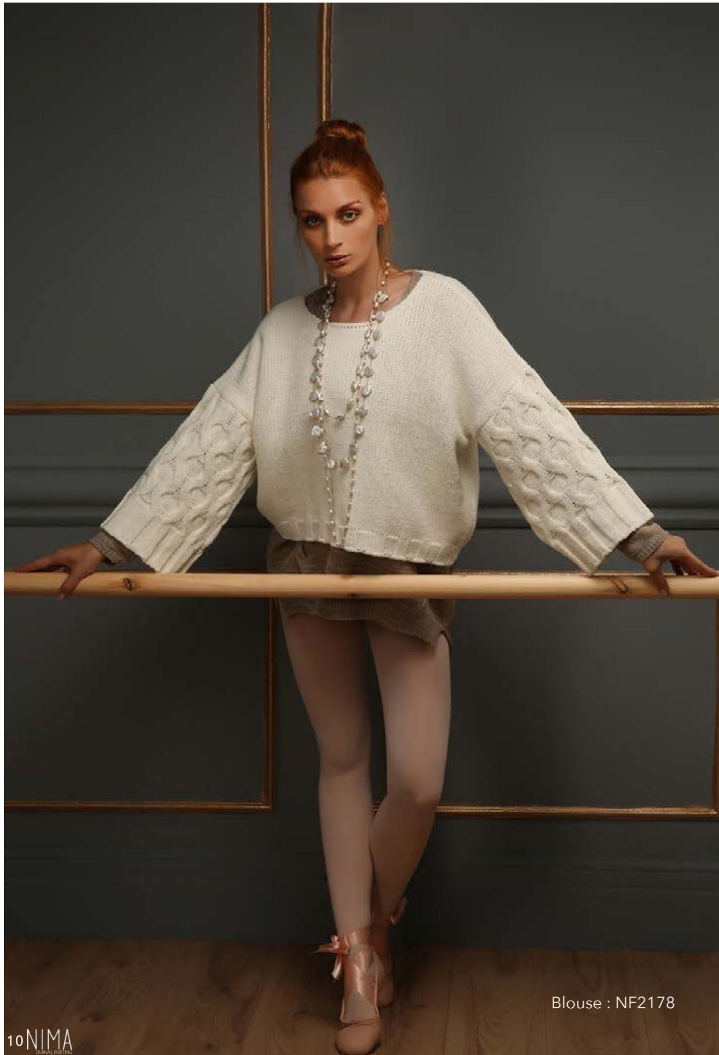
Blouse : NF2178