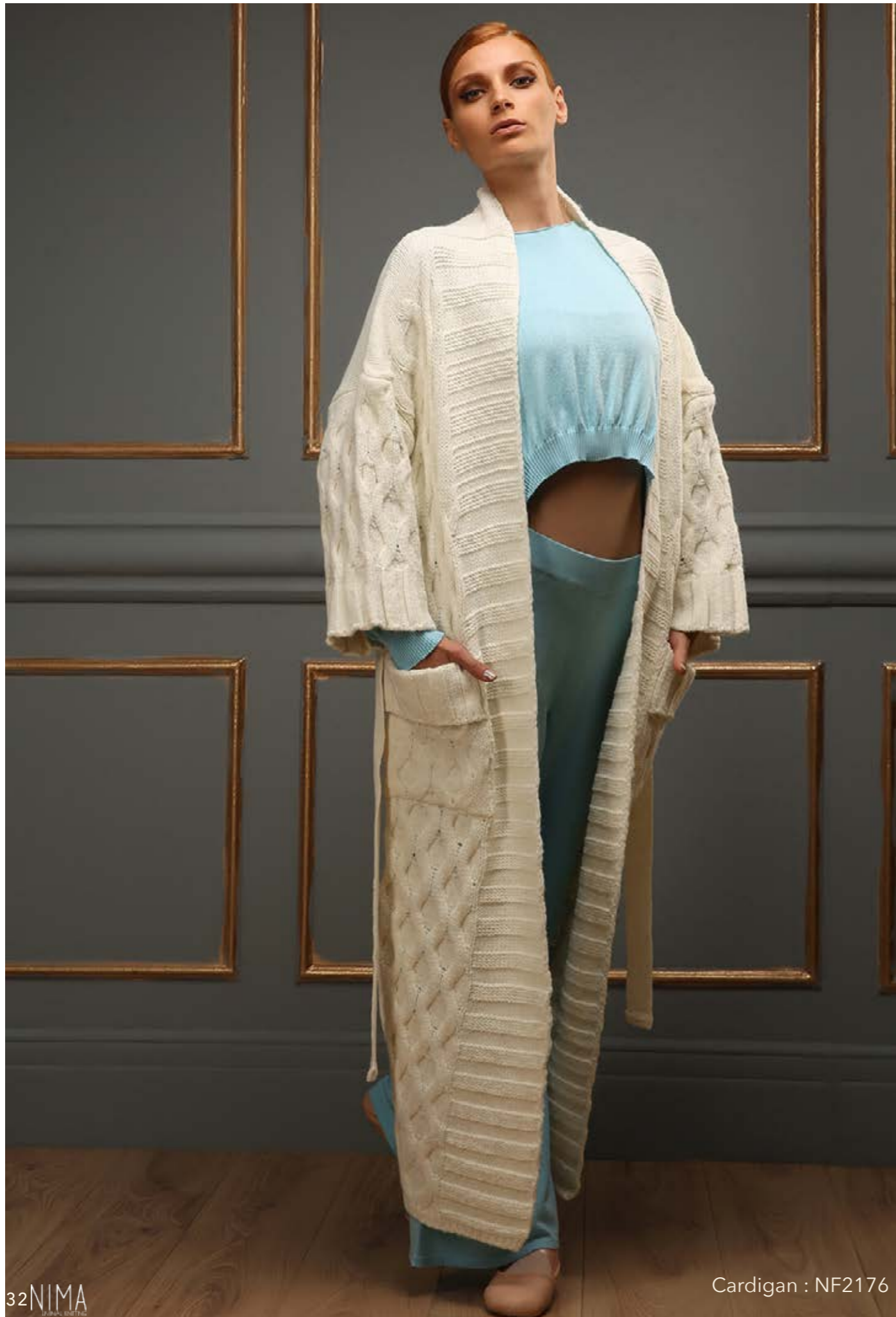
Cardigan : NF2176