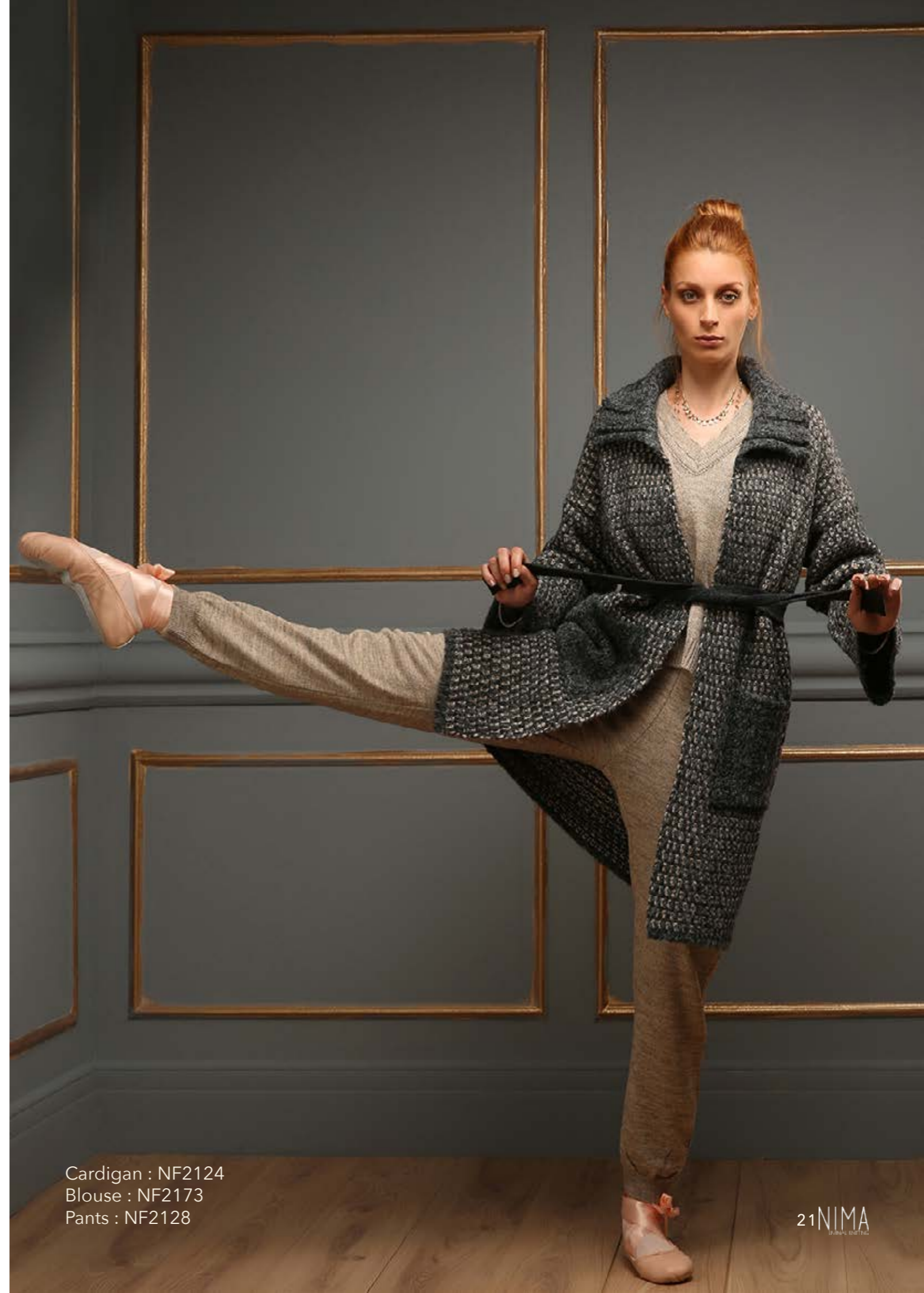
Cardigan : NF2124 Blouse : NF2173 Pants : NF2128