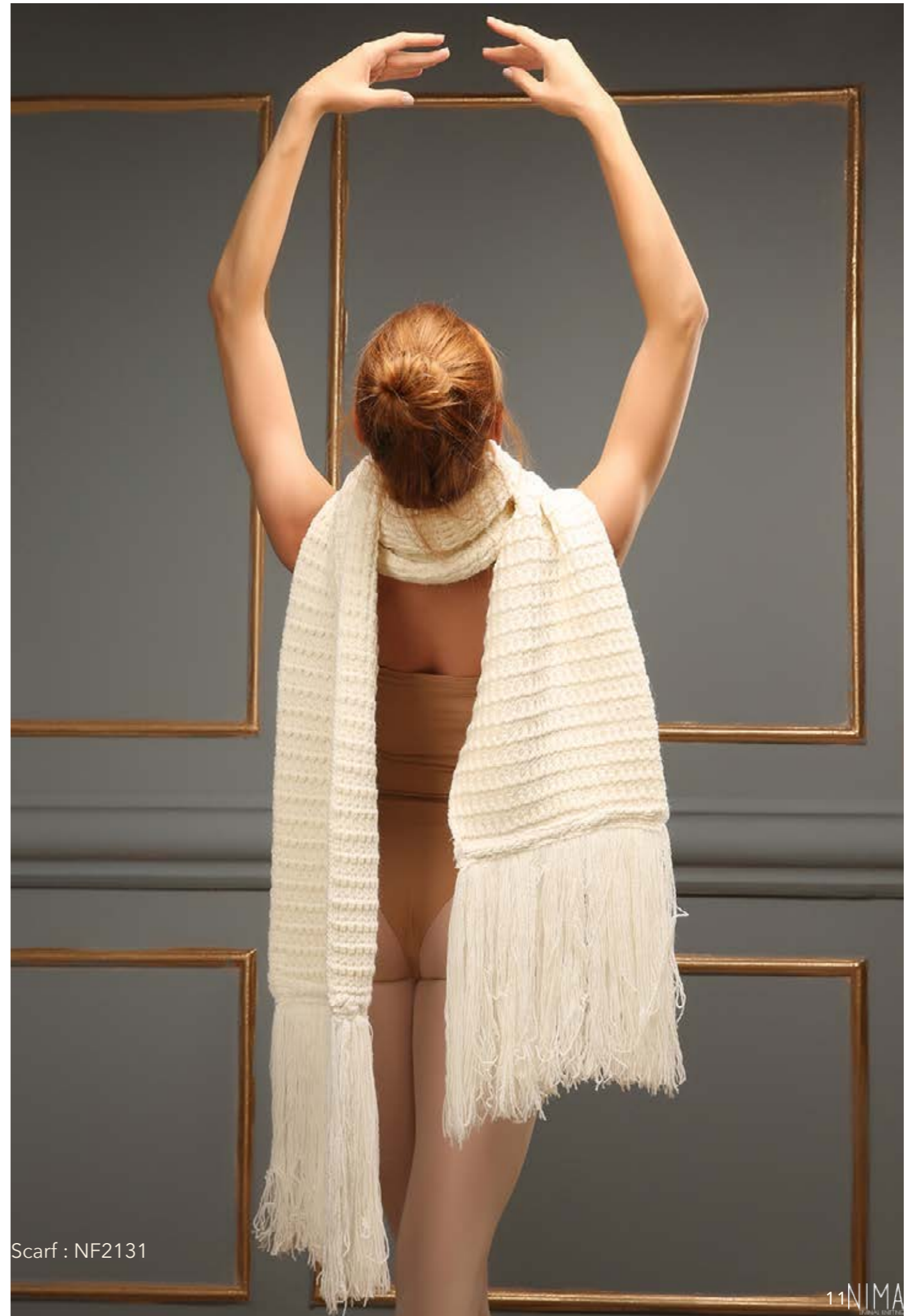
Scarf : NF2131