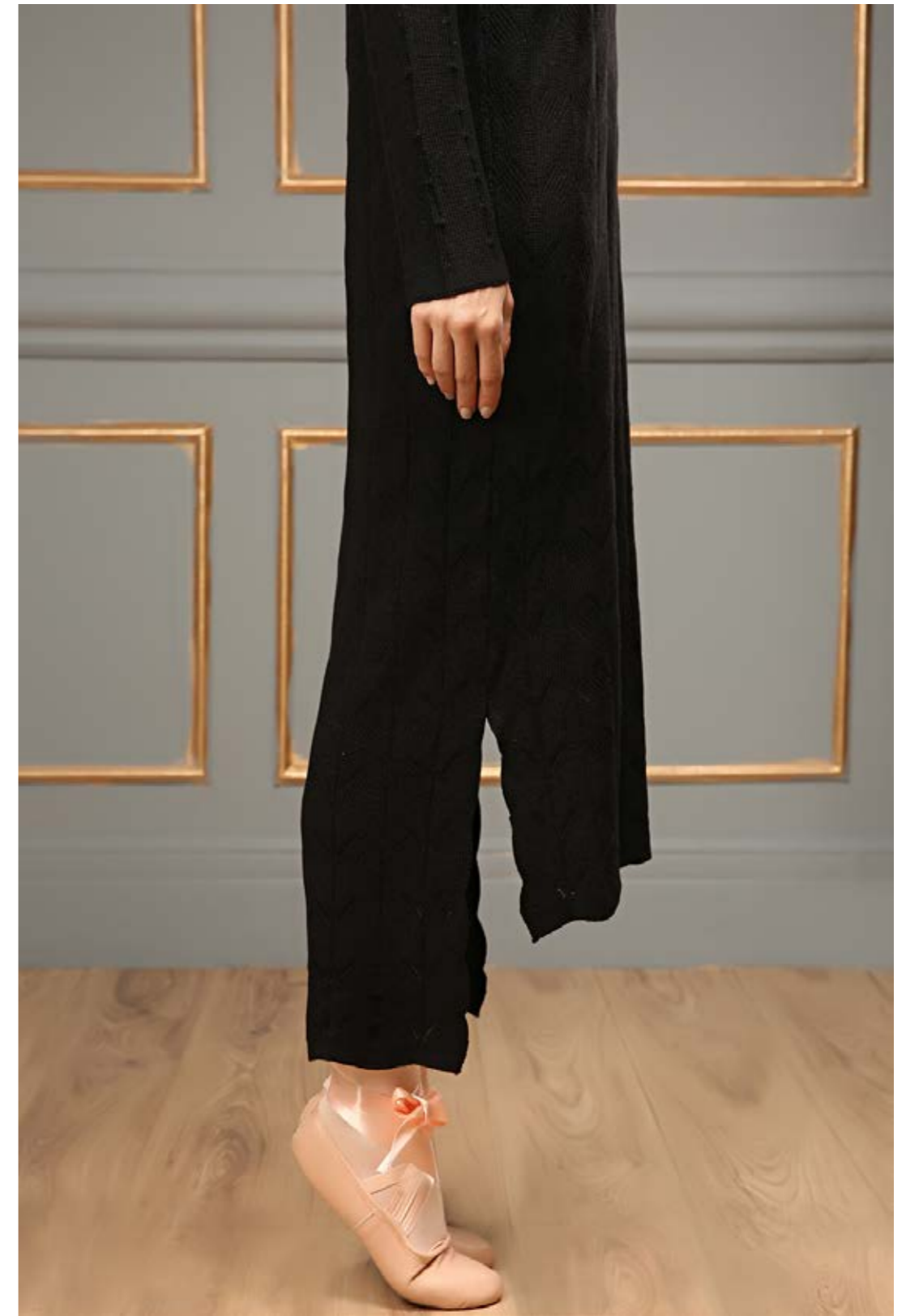
Dress : NF2153