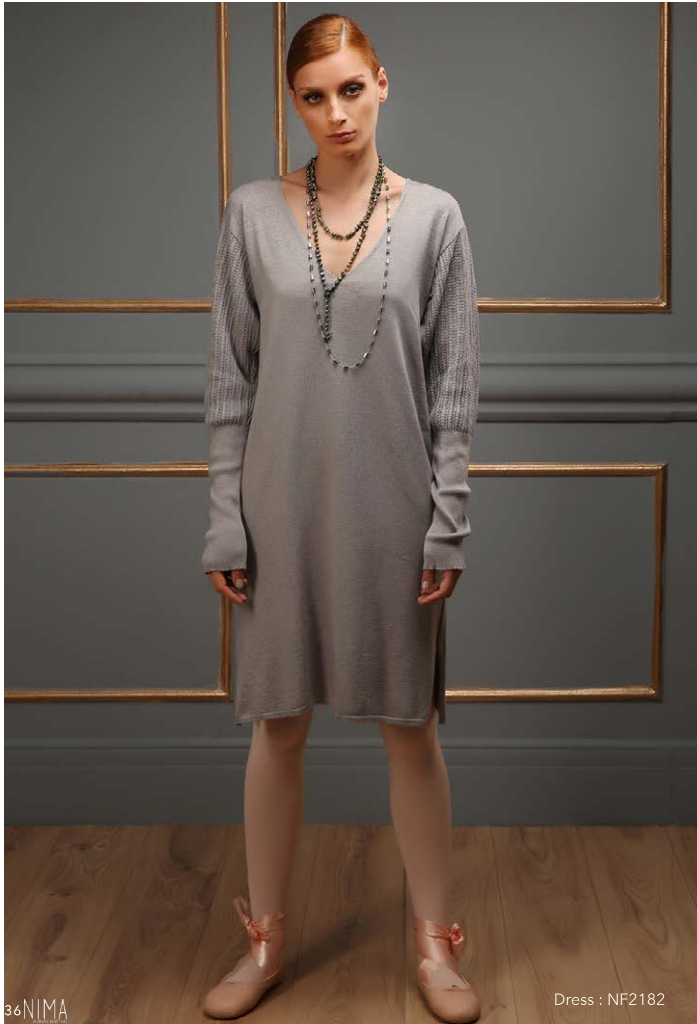
Dress : NF2182