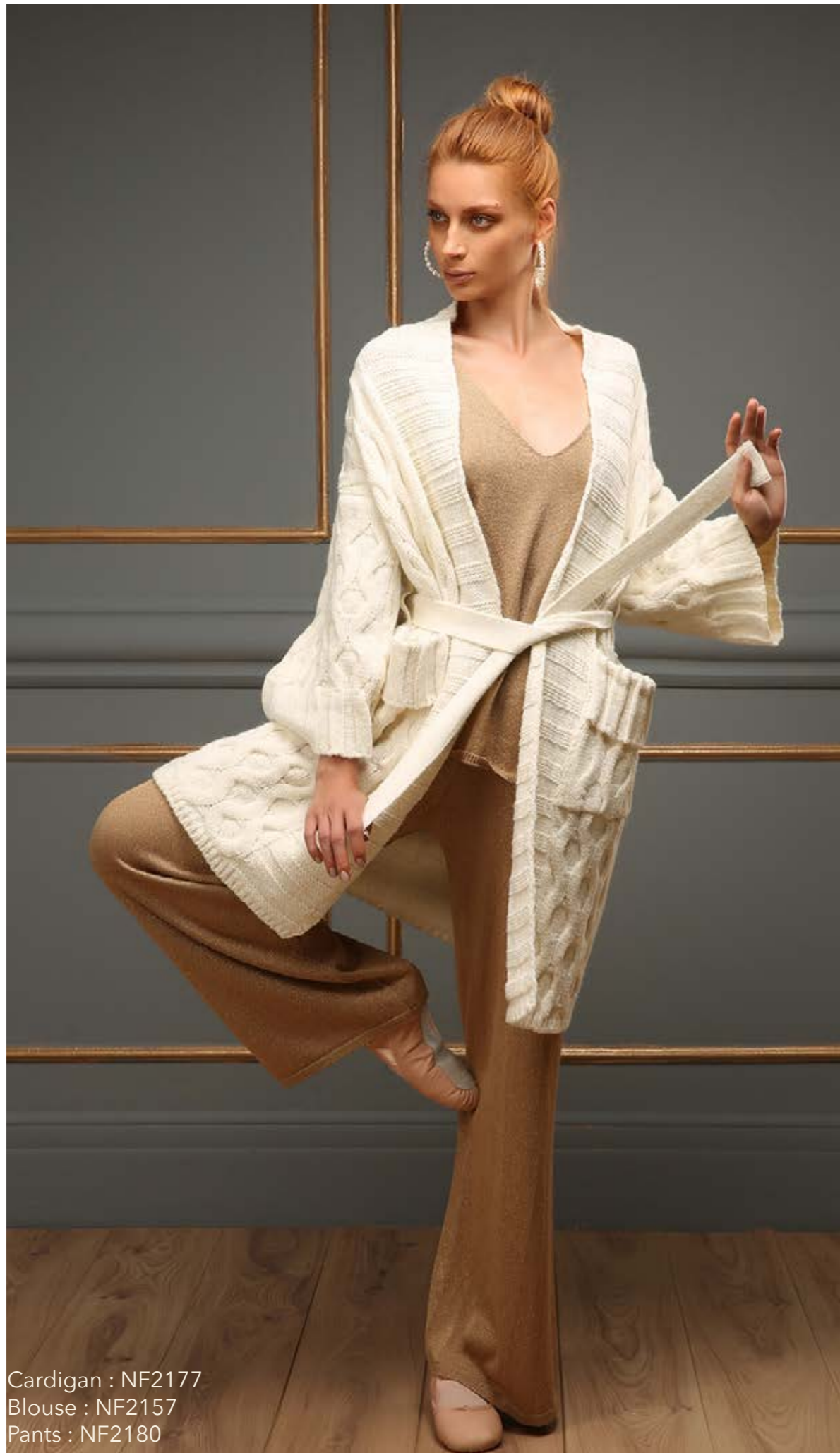
Cardigan : NF2177 Blouse : NF2157 Pants : NF2180