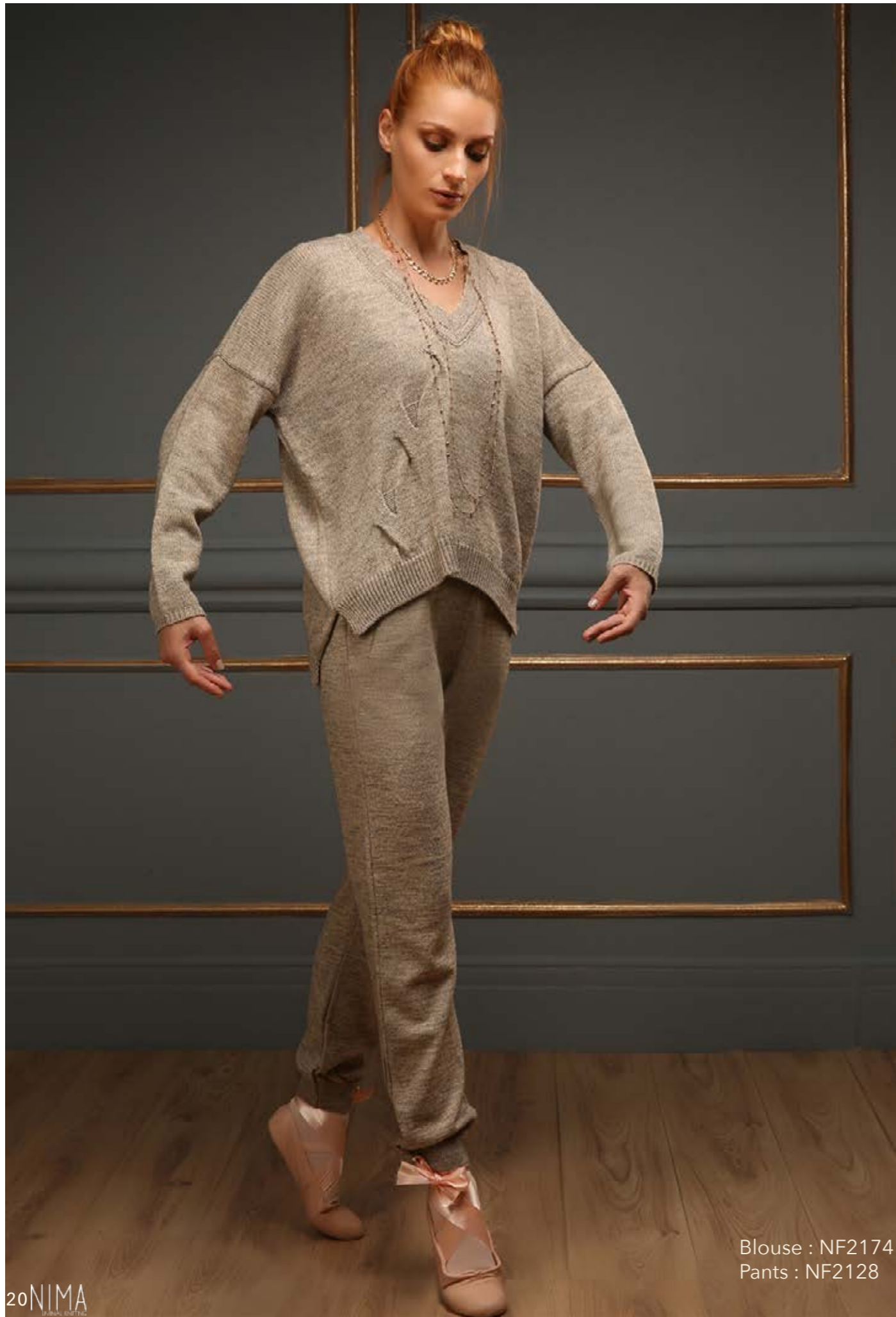
Blouse : NF2174 Pants : NF2128