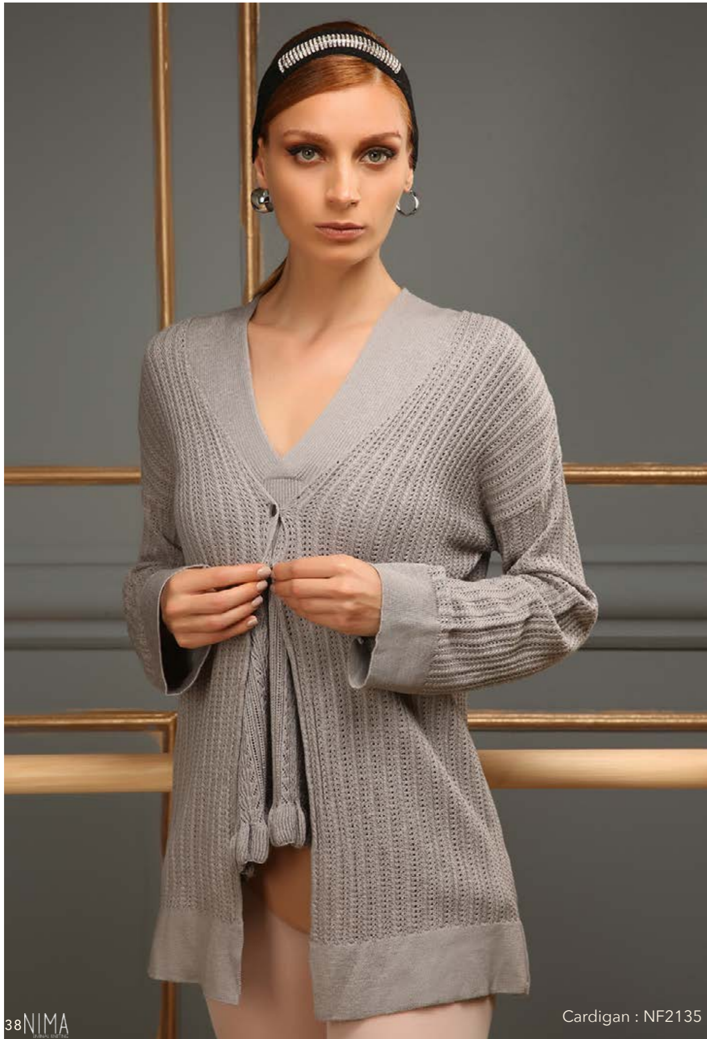
Cardigan : NF2135