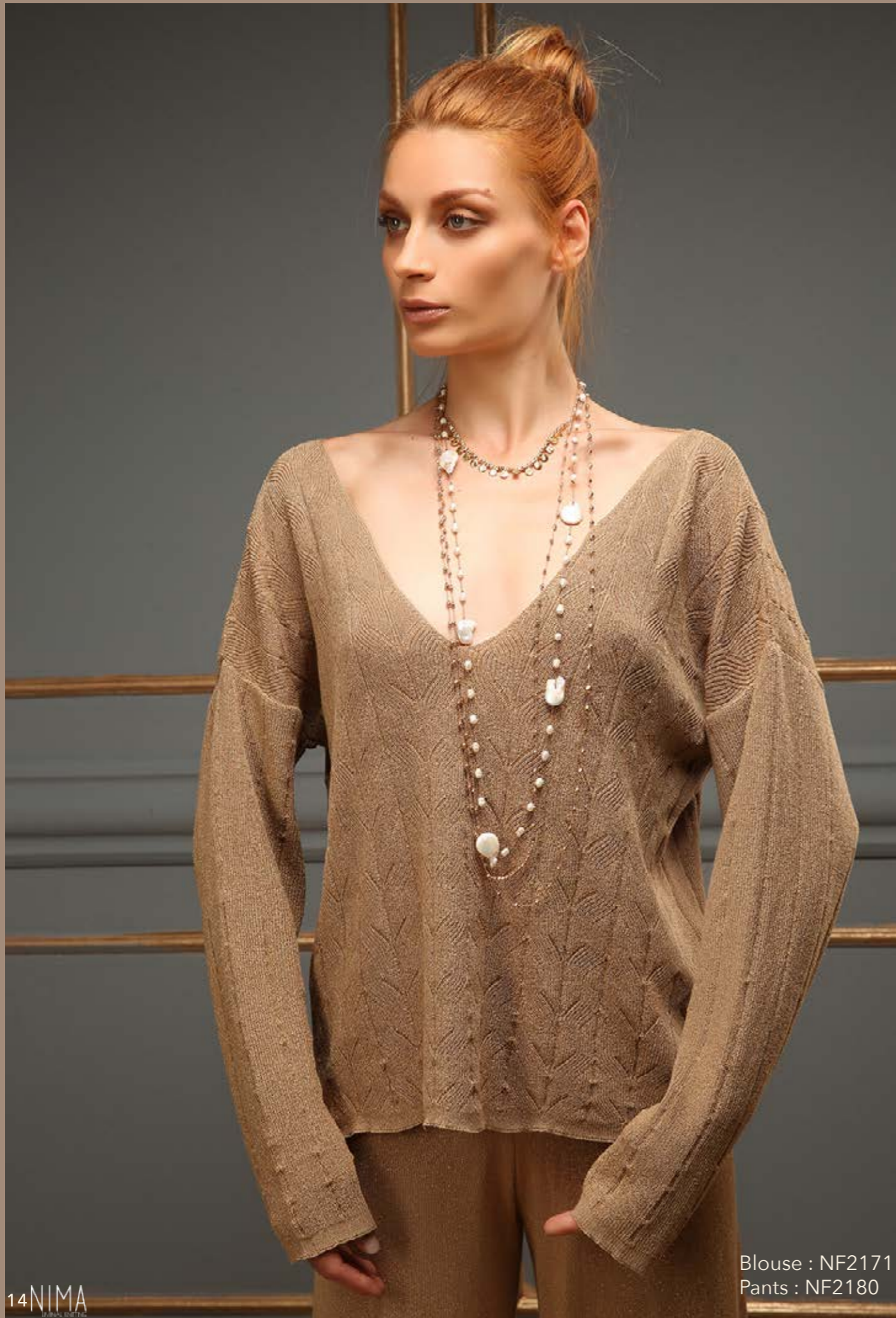
Blouse : NF2171 Pants : NF2180