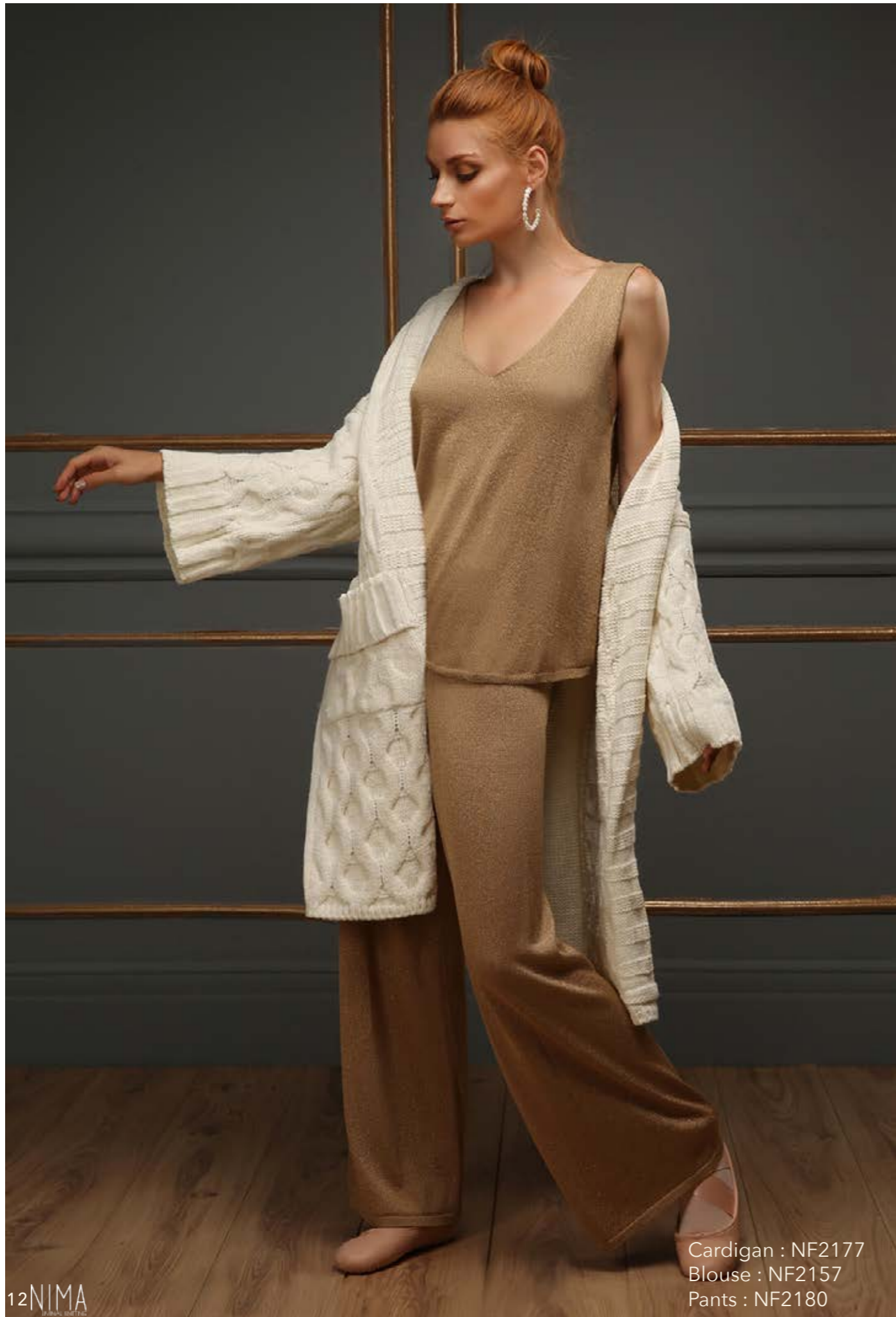
Cardigan : NF2177 Blouse : NF2157 Pants : NF2180