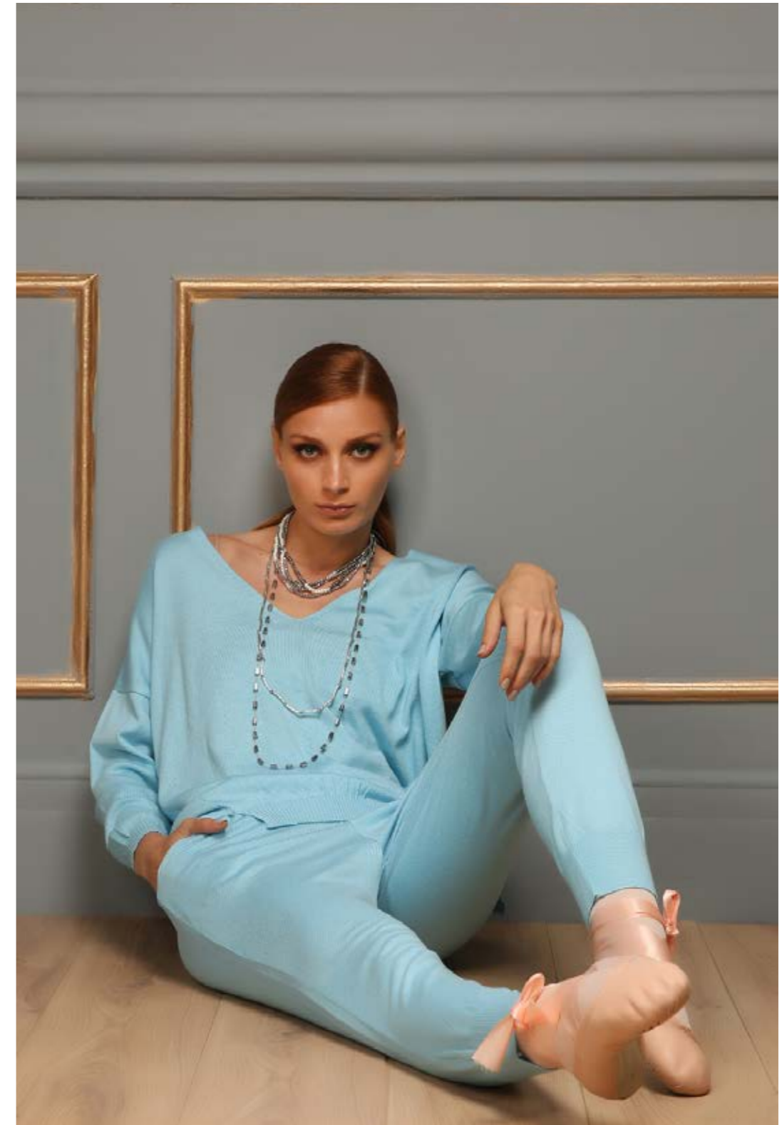
Blouse : NF2139 Pants : NF2148