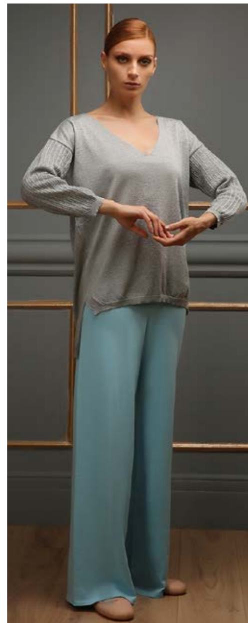
Blouse : NF2163 Pants : NF2149