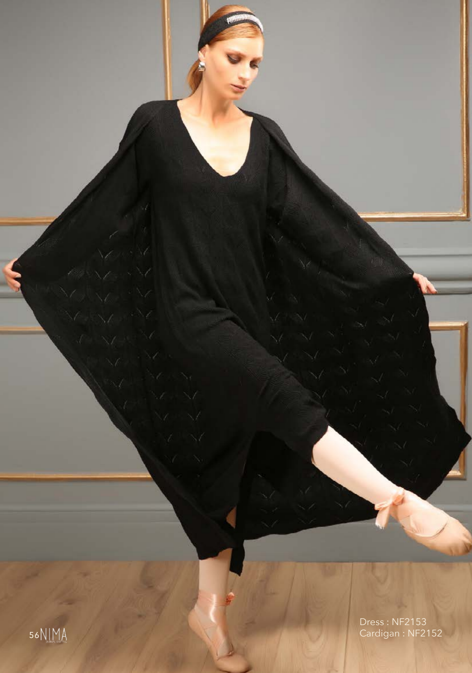
Dress : NF2153 Cardigan : NF2152