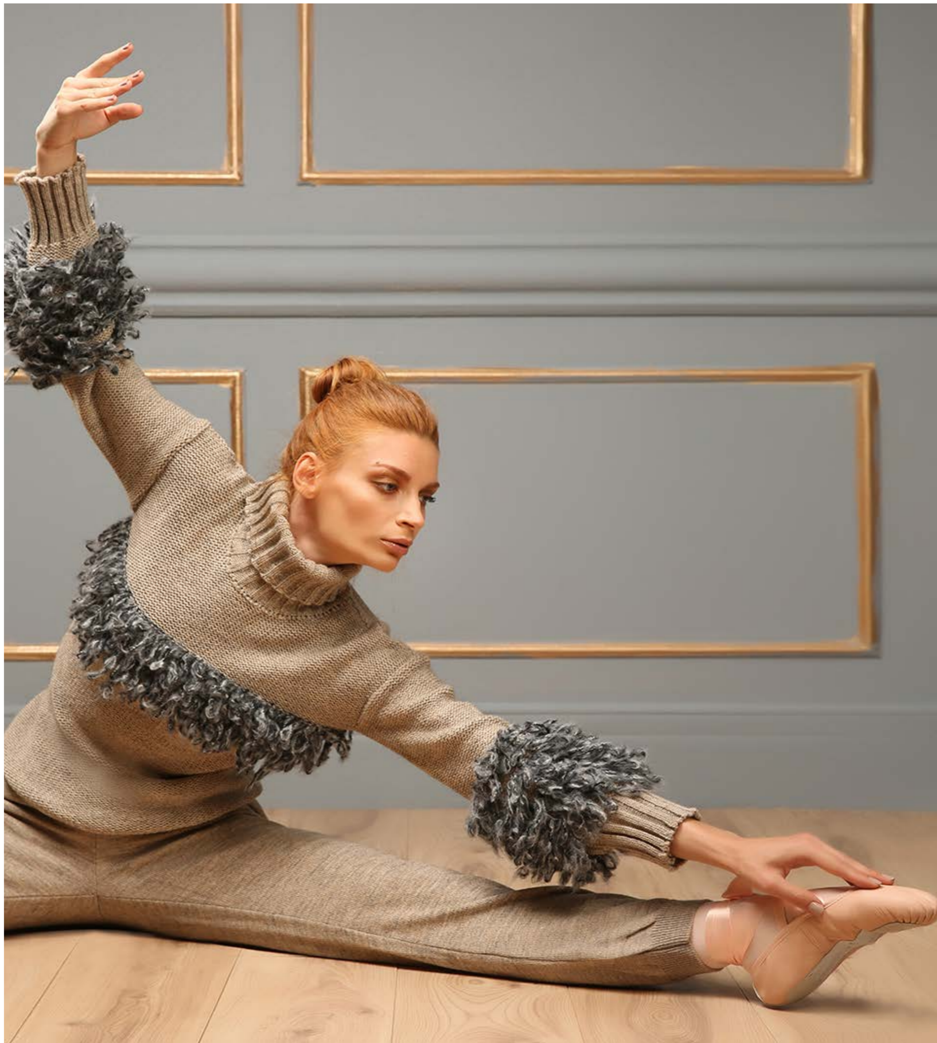
Blouse : NF2126 Pants : NF2128