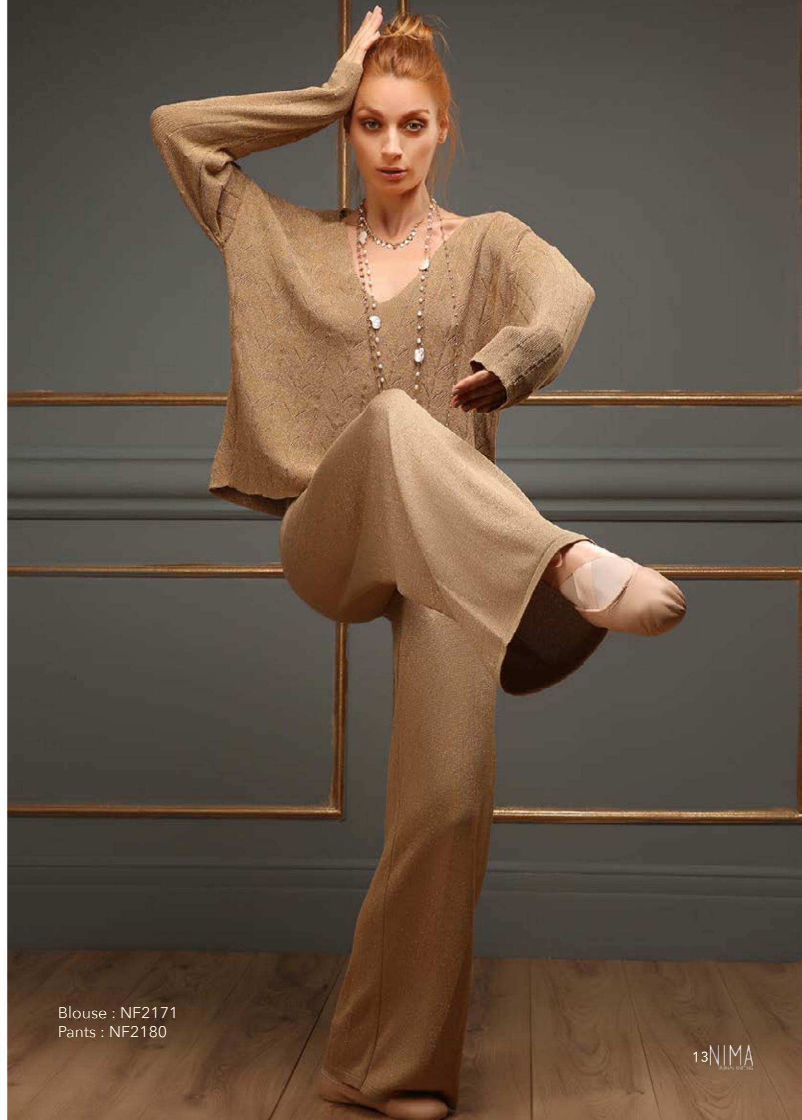
Blouse : NF2171 Pants : NF2180